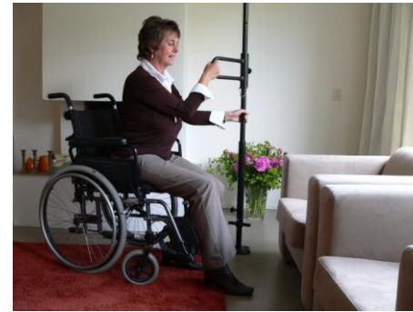
Van rolstoel naar stoel

PAKPAAL PRODUKTIES BV Web-site www.pakpaal.nl Email info@pakpaal.nl Tel: 076-5614500 Fax: 076-5614675 KvK □ 200.87.110