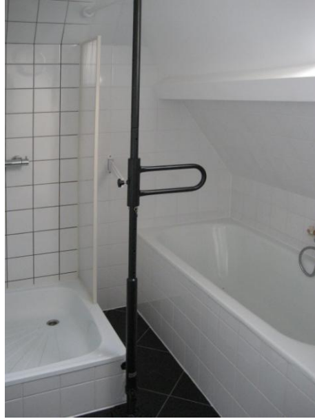
Naast douche of bad