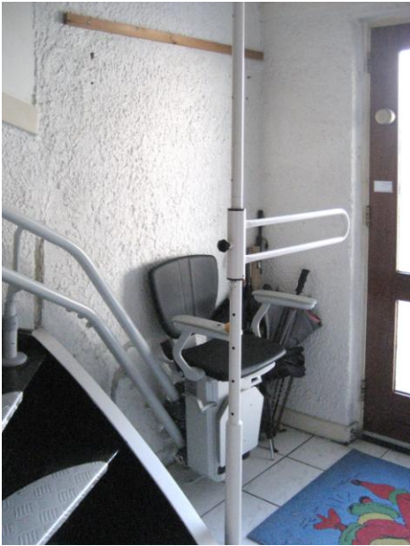
Naast een traplift