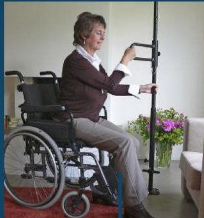
Van rolstoel naar stoel