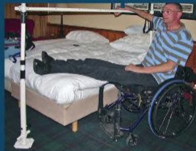
Opstaan uit bed