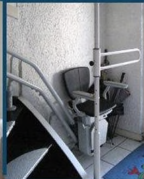
Naast een traplift