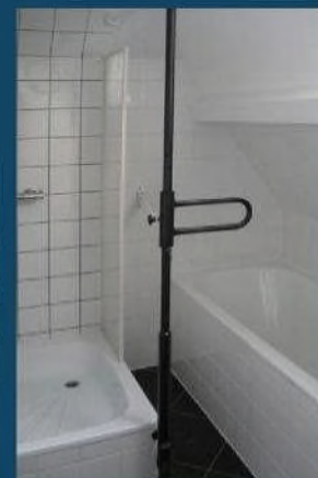
Naast het bad